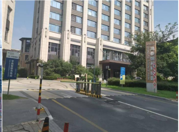
鸿泰悦和大厦【上海虹畅物业】