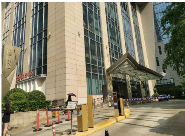
高和大厦【上海中企物业】