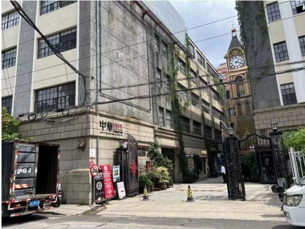
中华园1912【上海仲华置业】