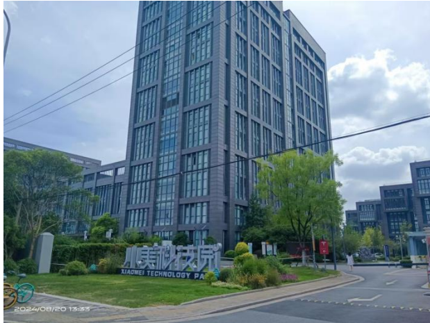
小美科技园【奥林匹克物业】