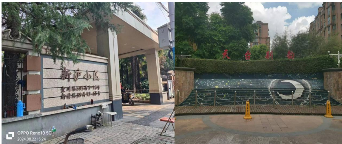
天台星城【上海轻工物业】