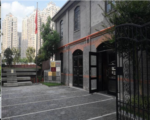
上海益民食品一厂历史展示馆